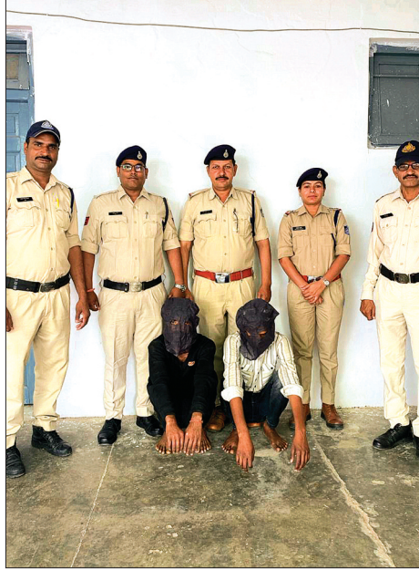
हरिभूमि न्यूज ►► सीहोर

रात के समय ढाबे से खाना खाकर पैदल घर लौट रहे दो युवकों के साथ मारपीट कर मोबाइल और नगद रुपए छीनकर भाग गए थे आरोपी